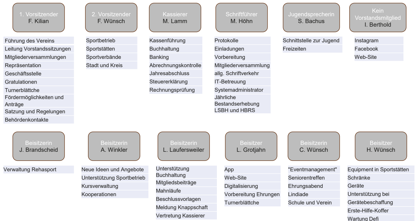
Aufgabenverteilung des Vorstands