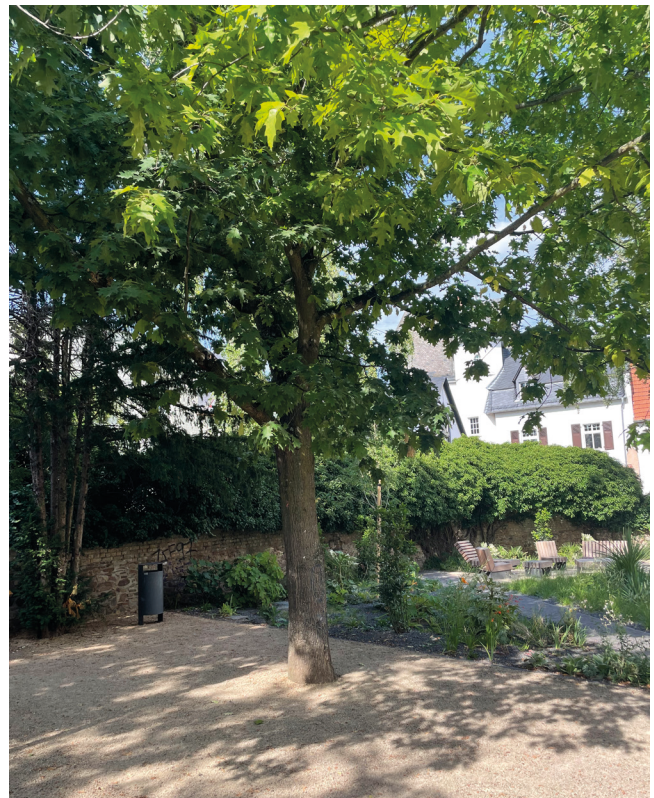
Die Turnereiche an prominentem Platz