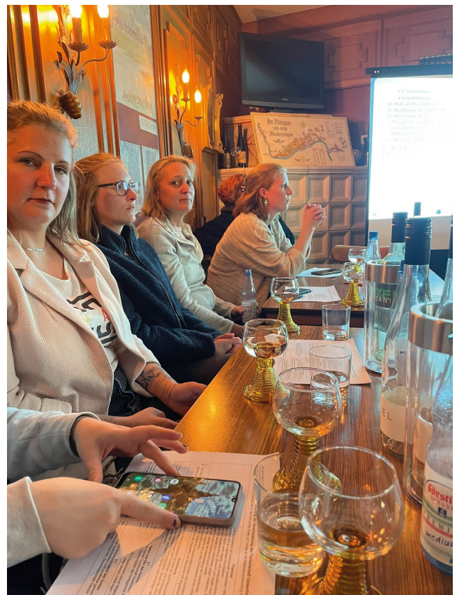
Frauenpower bei der Mitgliederversammlung