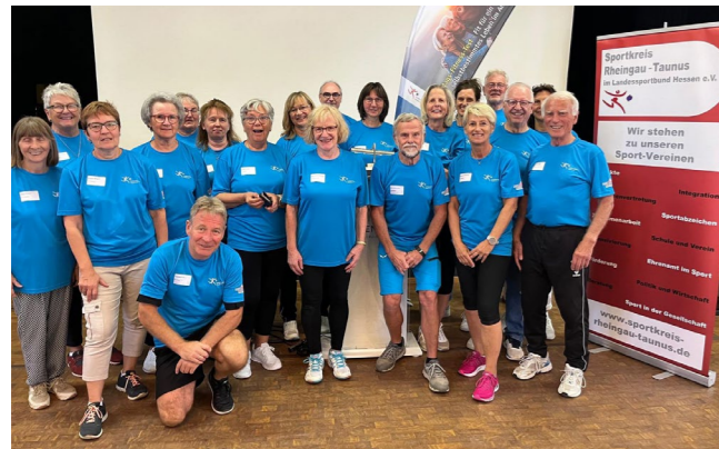
Wie fit bin ich im Alter: Gemeinsam mit dem Sportkreis Rheingau-Taunus und der Unterstützung der Geisenheimer Sportvereine konnten Geisenheimer Bürger ihre Fitness testen und bekamen Tipps, wie sie auch im Alter selbstständig leben können.