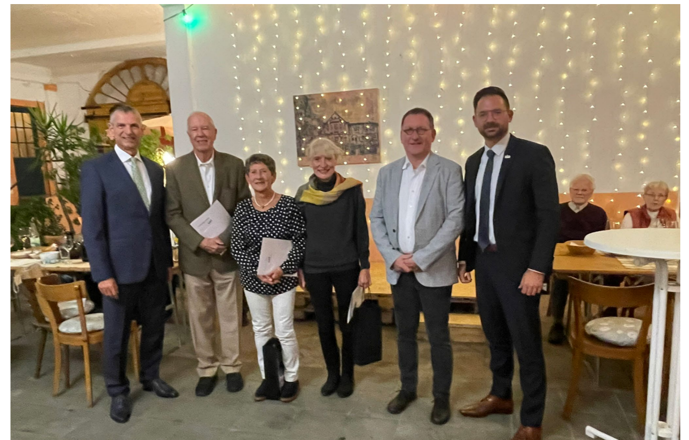
Ehrung für 60 und 70 Jahre Mitgliedschaft in der Turnerschaft Geisenheim