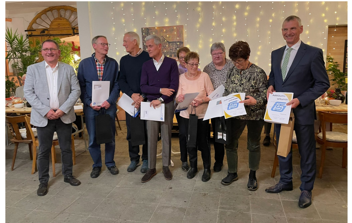
Ehrung für 50 Jahre Mitgliedschaft